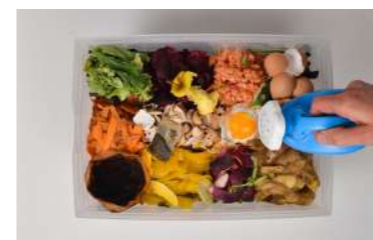
Illustration : compostage

Ce film est une métaphore qui met en parallèle la vie des arbres et celles des humains, un poème lyrique sur la naissance et la mort, une ode sur le temps qui passe. Il raconte l'histoire de la parentalité, allant au-delà des limites de chacun (pas seulement chez les humains). C'est une parabole sur les relations, un apparent désespoir et une promesse de bonheur..