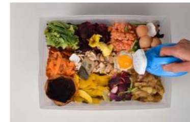
Illustration : compostage

Ce film est une métaphore qui met en parallèle la vie des arbres et celles des humains, un poème lyrique sur la naissance et la mort, une ode sur le temps qui passe. Il raconte l'histoire de la parentalité, allant au-delà des limites de chacun (pas seulement chez les humains). C'est une parabole sur les relations, un apparent désespoir et une promesse de bonheur..